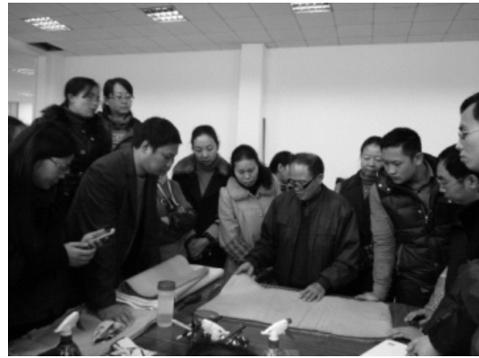
图为湖南省文化厅古籍修复培训班教学现场

3、点面结合, 省内培训班日趋常态化, 培训方式多样。2012年11月至12月期间, 由湖南省文化厅主办, 湖南图书馆承办的湖南省文化厅古籍修复培训班在湖南图书馆举行, 来自全省25个古籍藏书单位、31名学员参加了学习, 培训时间将近1个月。