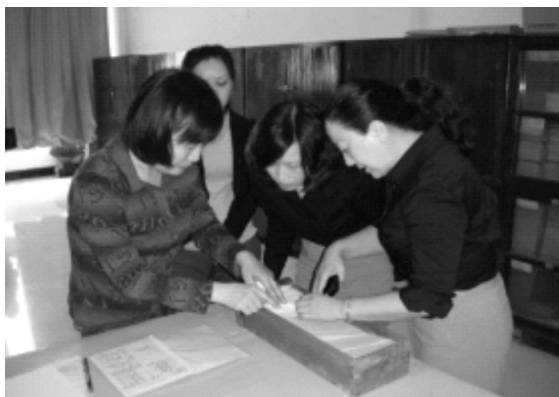
图为湘西自治州馆章馆长(左一)前来龙山馆指导古籍工作

(一)加强组织领导,统一思想认识。为确保古籍普查工作的顺利实施,我县成立了由分管文化工作的副县长任组长、文广新局领导为成员的领导机构,成立专门的古籍普查办公室来承担组织协调工作,统筹