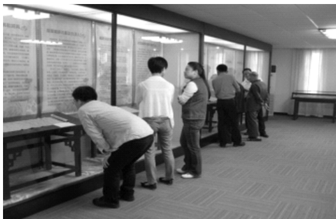
图为“敦煌写经惊现湖南”——湖南图书馆馆藏敦煌写经展览现场

3、公益宣传别开生面,展览讲座精彩迭出。为普及相关古籍保护知识,提高大众关注力和打造公益展览鉴赏平台,在古旧文献宣传方面我们不遗余力,先后举办大型公益性十余次,诸如“革命先声红色史迹”馆藏革命文献展、“敦煌写经惊现湖南”馆藏敦煌写经展、“文化瑰宝书海奇观”馆藏古籍丛书展览、“谁与斯人慷慨同”馆藏湖南辛亥人物墨迹展、“天地正气左宗棠”——湖南图书馆馆藏左宗棠手札墨迹展、纪念毛泽东《在延安文艺座谈会上的讲话》发表 70 周年大型展览等等,在湘潭市图书馆、长沙市图书馆、湖南图书馆等单位开展《古籍普查与保护》、《古籍收藏与造伪》、《中国族谱史略及湖南族谱特征》等专场的古籍知识公益讲座,讲学论道,将深厚的专家理论贯彻到具体的实践中去。2010 年,还与国家古籍保护中心在湖南图书馆联合举办“中国古代书籍史展”,努力让古籍保护的观念渗透到社会的方方面面。